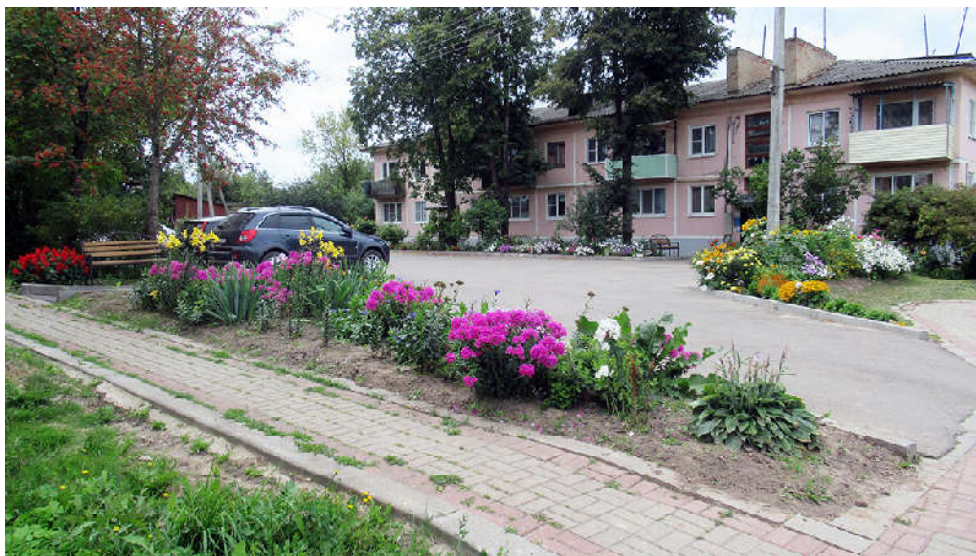
Великолепный дворик обустроили жильцы домов № 8 и № 9 по ул. Трубникова. Утопает в цветах двор дома № 35 на Центральной.

Подтверждение тому – территории, до неузнаваемости изменившиеся после прошлогодних работ по благоустройству дворовых территорий.